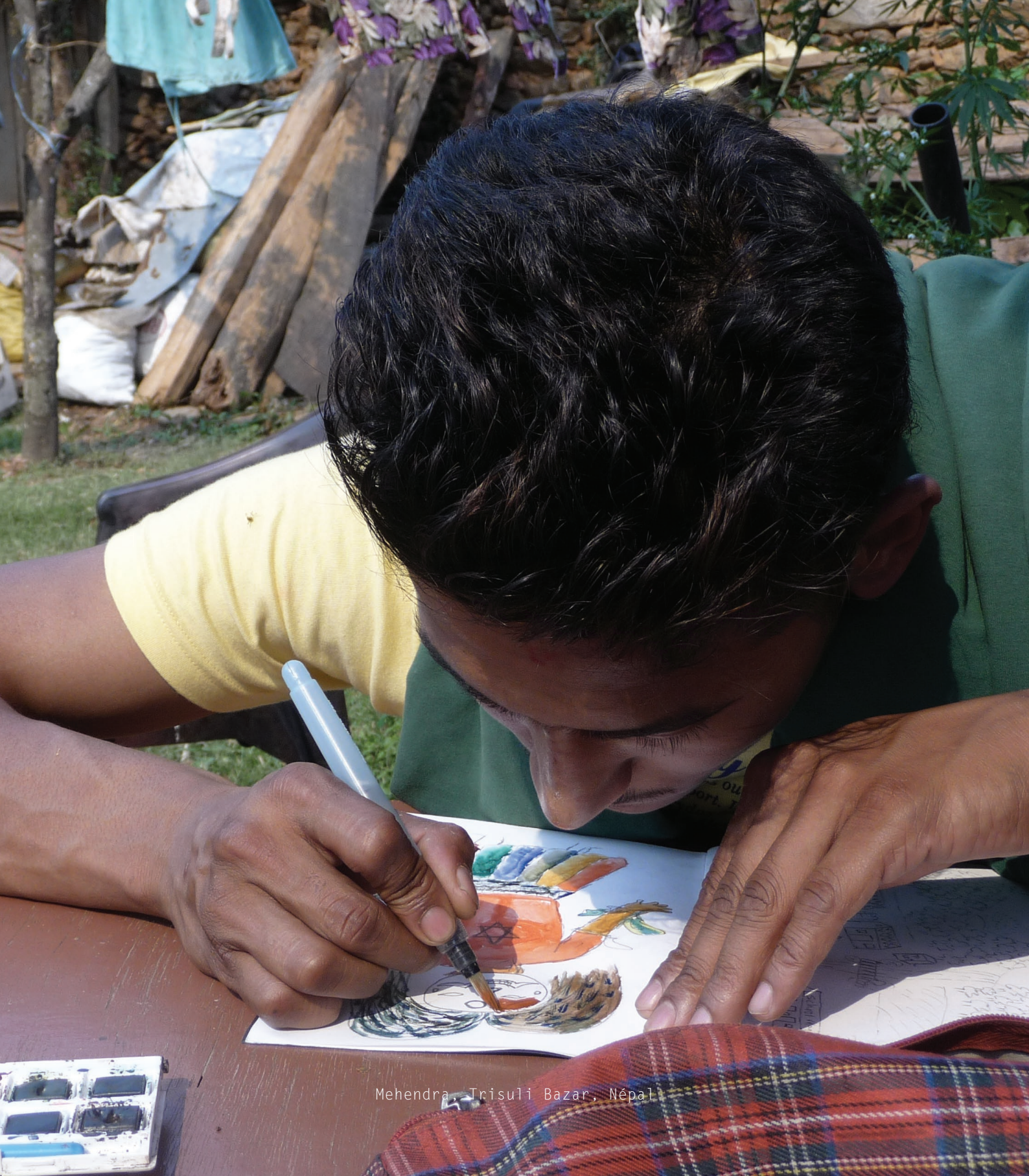
Mehendra, Trisuli Bazar, Népal