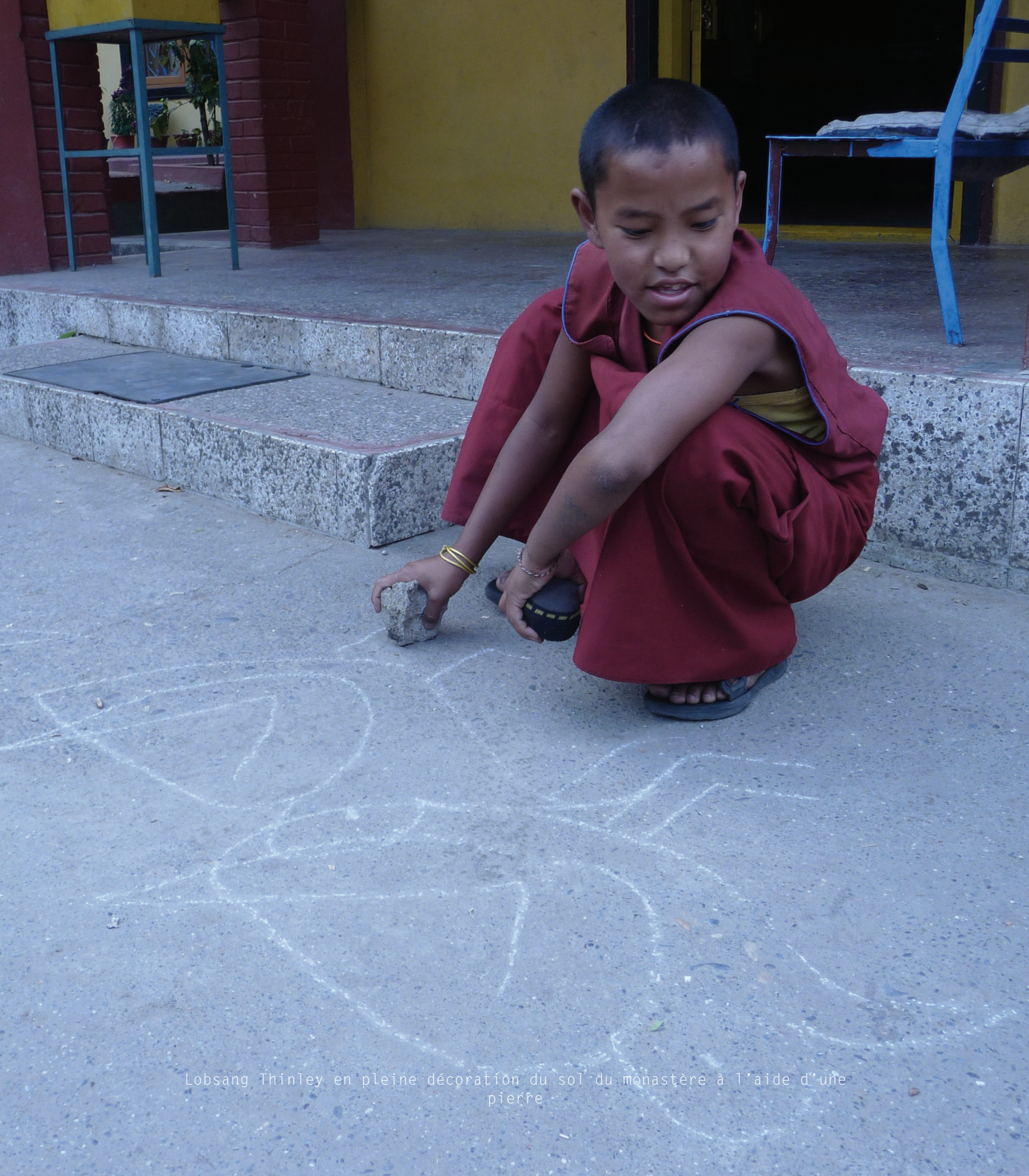
Lobsang Thinley en pleine décoration du sol du monastère à l'aide d'une pierre