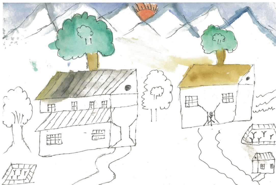
Dessin de Tenzin lekden (ci dessus), petit moine de Tashiling qui, ayant trouvé le dessin qu'une petite fille avait dessiné dans mon carnet tellement beau, la recopié en l'agrémentant d'un dragon.