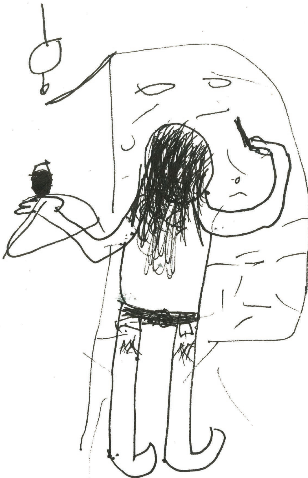
Tenzin Lekden, un petit moine de 13 ans du monastère de Tashiling m'a dessiné alors que je rénouvais le moulin à prière du temple.