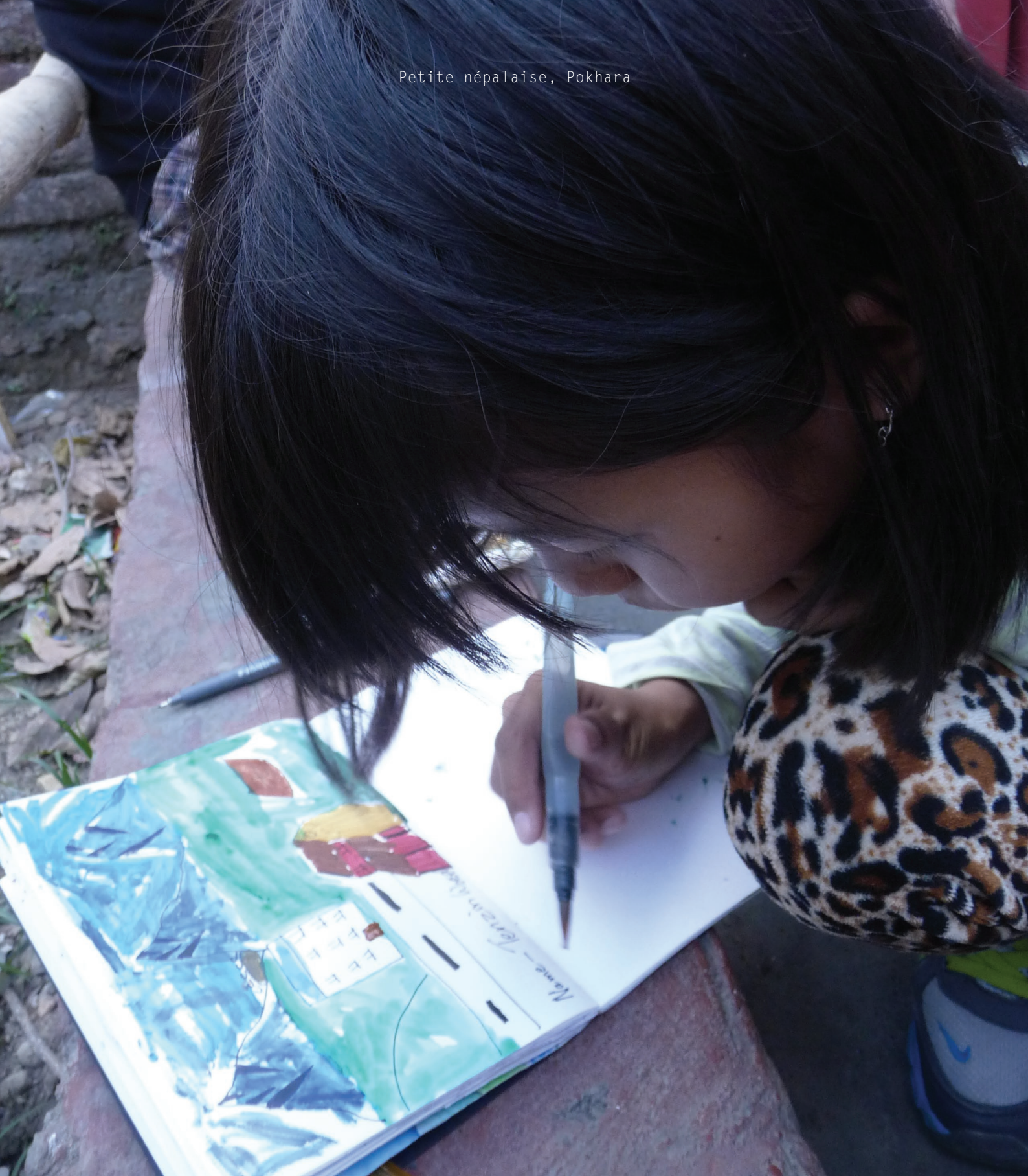
Petite népalaise, Pokhara